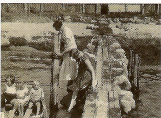
Rofylld stund vid stenpiren som underlättat för transport till tegelbåtar genom seklerna.

I rabatter vid utsidan av gräsmattan närmare huset planterades penséeer och aster. Mot havet intill stigen längs stranden planterades två halvcirkelformade rabatter som fylldes med blandade blommor. Mellan dessa kunde man följa en liten stig som ledde till en öppning mot havet och en stenpir.