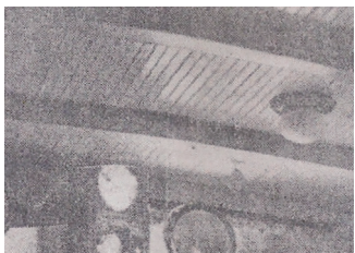
Bild från en tidningsartikel på 50-talet som visar innertaketets välvda konstruktion med friliggande bjälkar.